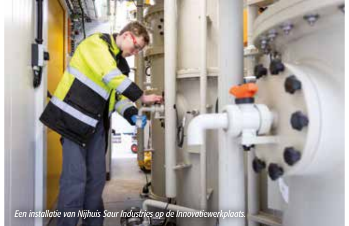
Een installatie van Nijhuis Saur Industries op de Innovatiewerkplaats.

Vaak is het een grote stap om van een goed idee naar een pilot te komen. Om innovaties in de circulaire economie een stap verder te brengen, heeft Waterschap Rijn en IJssel samen met de AVR, provincie Gelderland en gemeente Duiven de Innovatiewerkplaats ontwikkeld.