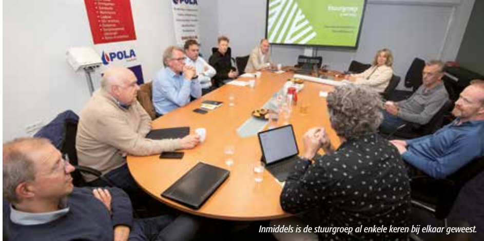
Inmiddels is de stuurgroep al enkele keren bij elkaar geweest.

Herinrichting van de Edisonstraat, het vergroenen van bedrijventerreinen en het verbeteren van fiets- en wandelroutes. Er staat de komende jaren veel te gebeuren op Hengelder en Tatelaar. Beide bedrijventerreinen verdienen een opknappbeurt en worden toekomstbestendig gemaakt.